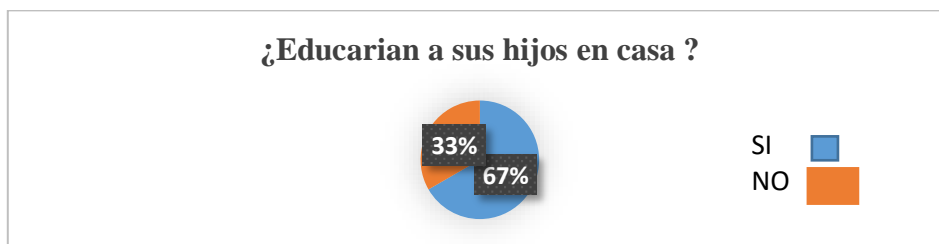
Figura 4. Educar a sus hijos en casa

Con esta experiencia, pretendemos mejorar el proceso de aprendizaje de los alumnos y dotar de mayor realismo la realización de las actividades de la asignatura. Esta actividad se plantea, además, para que los alumnos se familiaricen con la prensa económica y extraigan conclusiones de las noticias que se les presentan asociadas a los temas explicados en clase (p.189).