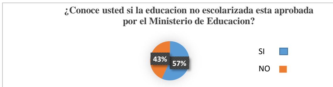
Figura 3. Legalidad de este tipo de educación

Los responsables de preservar los derechos de los niños son los padres, tutores y están encargados de proveer lo necesario para propiciar el respeto a la dignidad de la niñez y el ejercicio pleno de sus derechos, así como de otorgar facilidades a los particulares para que coadyuven a su cumplimiento (438).