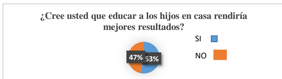
Figura 5. Resultados de educar en casa

En la gráfica se puede observar que el 67% de la población si educaría a su hijo en la casa ya que comentan que nada cambiaría que la forma de estudio es igual en casa como un establecimiento educativo, mientras que el 33% no educaría a sus hijos en casa por la falta de conocimiento de los beneficios que este tipo de educación posee. Casas y Arturo (2014) afirma “En el cumplimiento de múltiples derechos se está haciendo un análisis de lo anterior se describen algunas acciones que desarrollan en su ejercicio y que propician el cumplimiento de los derechos de los niños entre ellos la educación” (p.189).