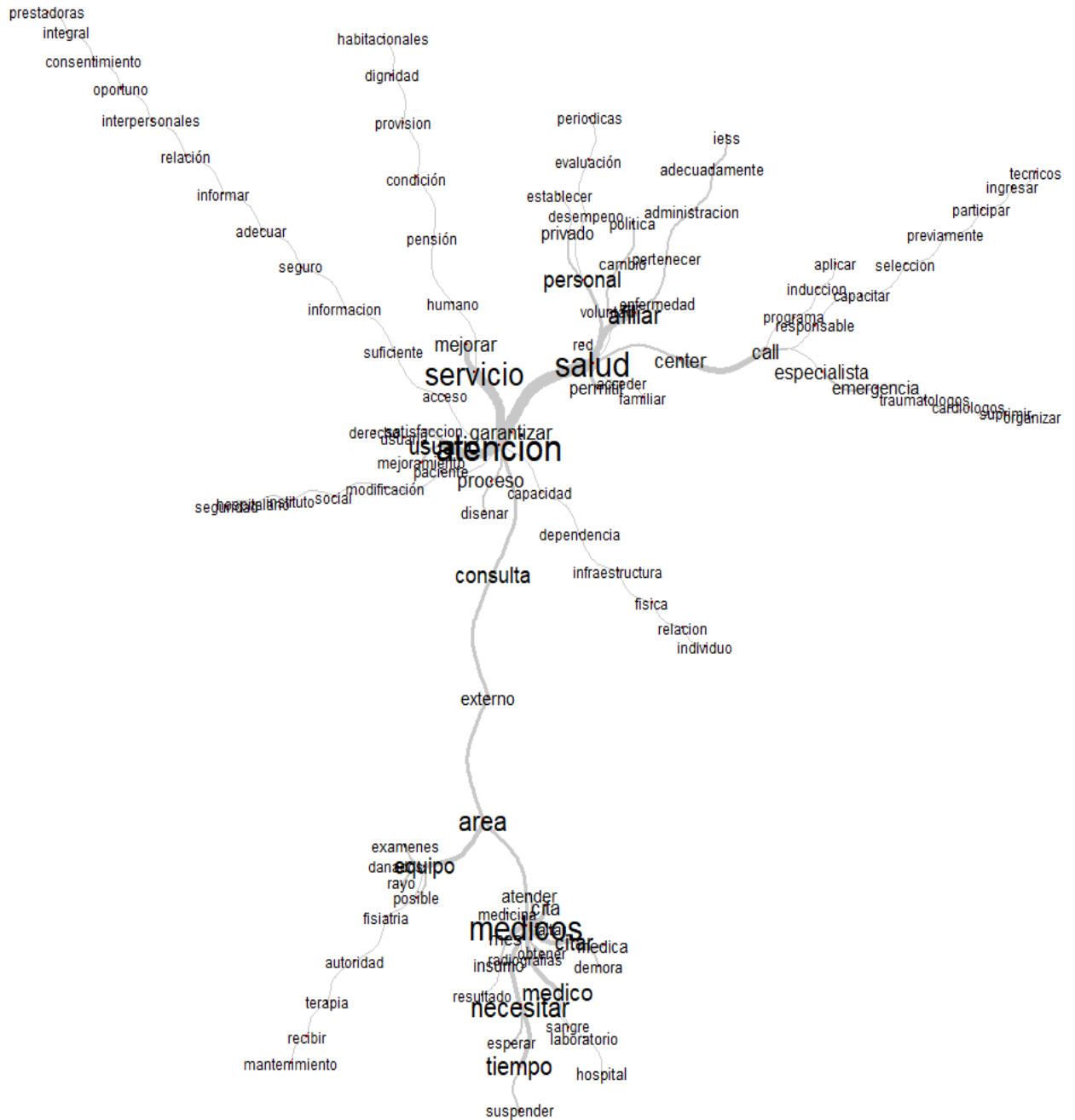
Gráfico 2 Diagrama semántica de factores de calidad de asistencia médica en el Hospital IESS (Milagro)