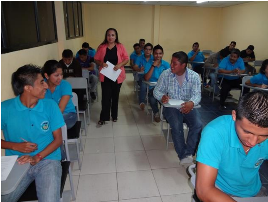
Imagen 6. Sindicato de Choferes Profesionales del Cantón La Maná en Pruebas Teóricas

Autor: Sindicato de Choferes Profesionales del Cantón La Maná