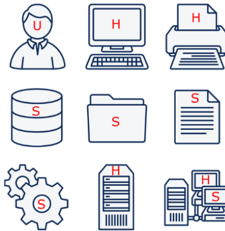
Imagen 3. Elementos de un Sistema Informático

informático como utilizador fina se desempeña en dos actividades que son fundamentales: toma de decisiones y control.