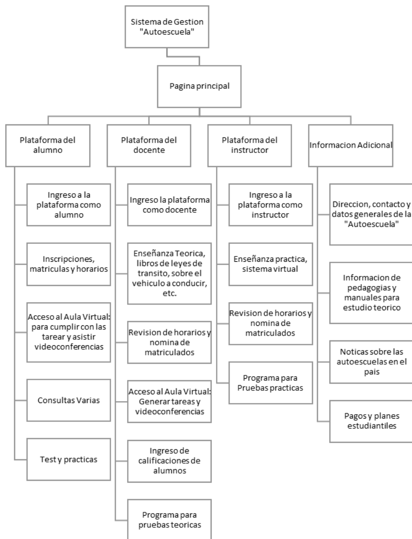
Figura 2. Esquema del sistema de gestión informático "Autoescuela", esquema realizado por el autor de este ensaño, en el cual muestra, la idea de cómo va a ser este sistema de gestión para las escuelas de conducir. Este esquema y des conceptuales y mejora la idea.

Se mostrará a continuación como va a ir el sistema de gestión informático que llevaran las autoescuelas para su desempeño tanto en los alumnos como en los profesores e instructores. Mediante una red conceptual el cual cumplirá con los parámetros, y así también cumpliendo el propósito principal de esta idea.