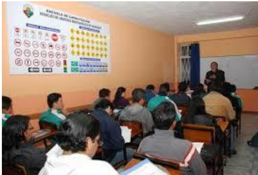
Imagen 4. Aula de una autoescuela o escuela de conducción