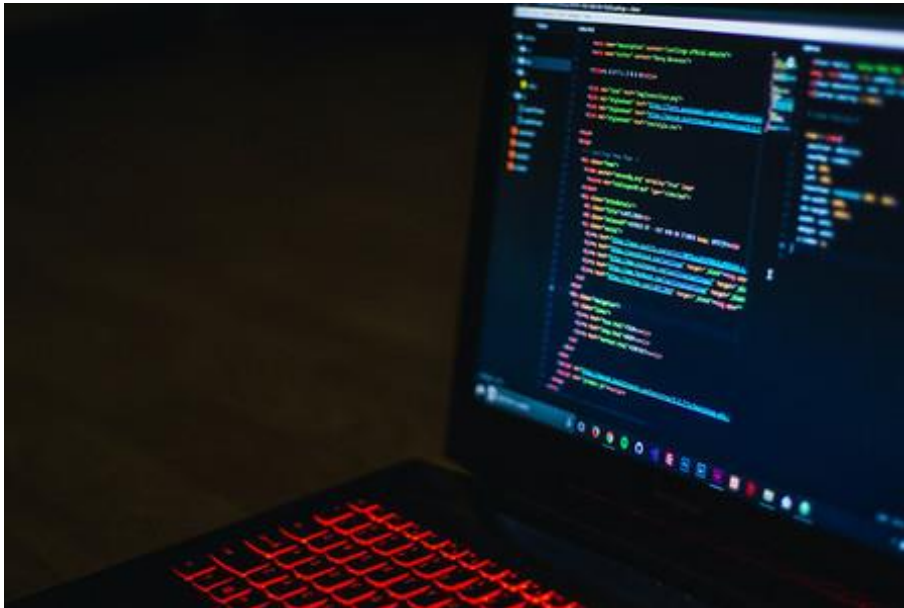
Imagen 2. Descripción de Informática