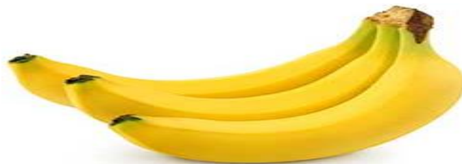
Gráfico 4.- Banano.

Ayuda a que nuestros huesos absorban con mayor facilidad el calcio , ya que contiene altos niveles de fructooligosacáridos.