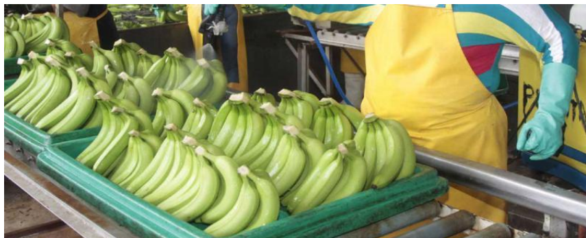
Grafico 1.- Producción.

El banano es el principal rubro de exportación no petrolera del país. En el 2015 Ecuador exporto alrededor de 120 millones de cajas de la fruta. El cultivo de banano ha sufrido en el pasado una reducción en su producción debido a enfermedades como hongo de la sigatoka negra y todavía mantiene bajos rendimientos por hectárea, en comparación con otros países productores.