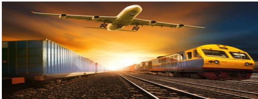
Grafico 2.- Comercialización o Exportación.

La actividad opuesta a la de exportación es la de importación, que por el contrario supone ingreso, la instrucción de bienes o servicios de orig foráneo a una nación exportación balanza comercial.