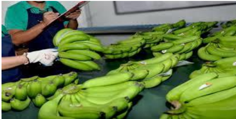
Grafico 5.- Aspecto socio económico.