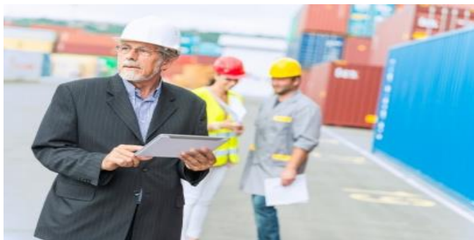
Gráfico 3.- Comercialización o Exportación.