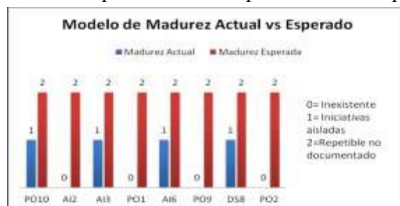
Fig. 2: Resultados esperados con la aplicación de los proyectos

Basado en la premisa planteada por los resultados la Tabla II, se recomendó una meta alcanzable para el CEC-EPN de llevar a los 8 procesos propuestos a un nivel de madurez 2 según COBIT, que, si bien podría parecer muy poco ambiciosa, hay que considerar que todos los procesos bases, es decir, los de planeación están en un nivel 0, por lo que mal podría aspirarse a mas cuando se tienen deficiencia en la planeación del área.