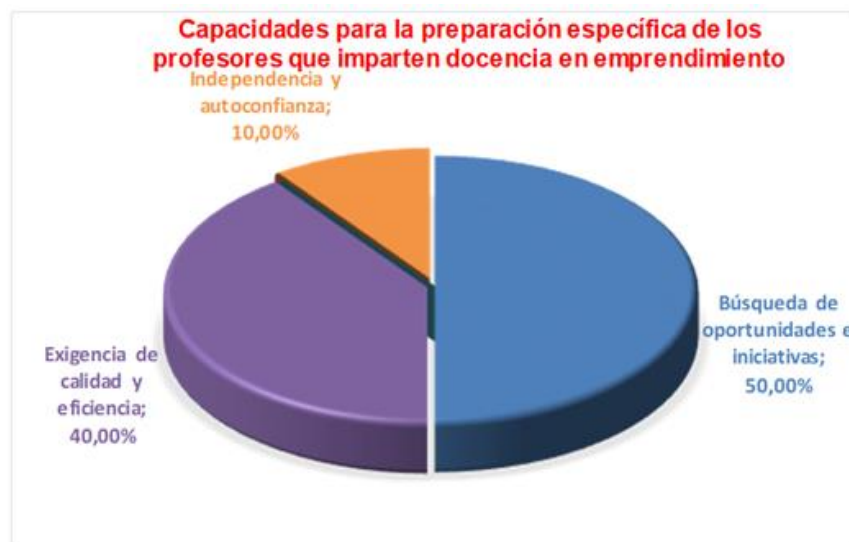
Figura 3. Capacidades para la preparación específica de los profesores que imparten docencia en emprendimiento.