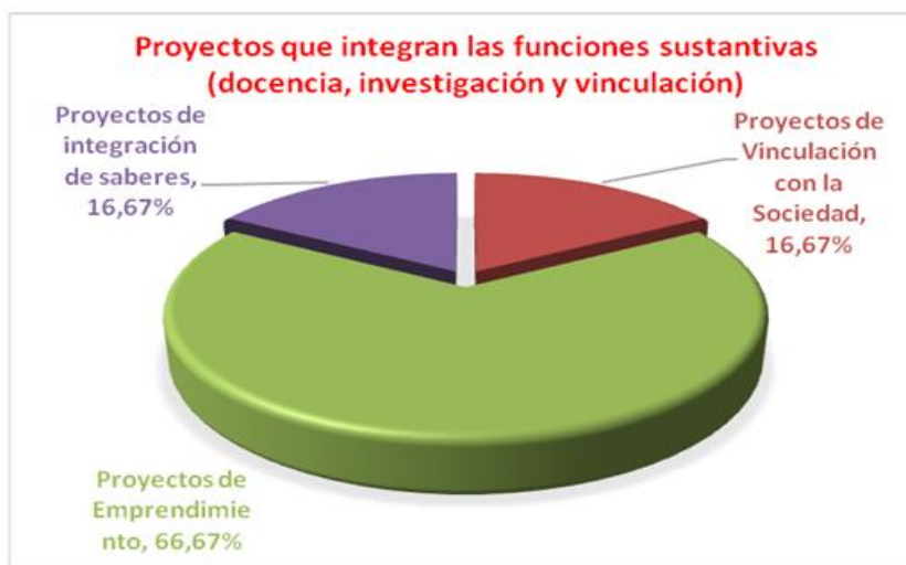
Figura 2. Proyectos que integran las funciones sustantivas (docencia, investigación y vinculación).

¿Cuál de los siguientes proyectos, según su criterio se enlaza al emprendimiento considerando las tres funciones sustantivas de la educación superior, docencia, investigación y vinculación con la sociedad?