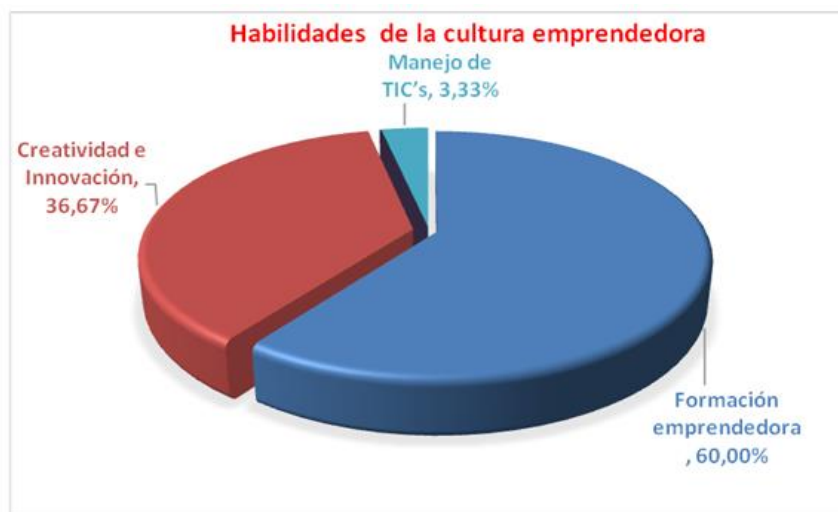
Figura 1. Habilidades de la cultura emprendedora.

¿En la formación de los estudiantes de su carrera, que opciones usted considera importantes para el desarrollo de sus habilidades que involucren el aprendizaje del espíritu emprendedor?