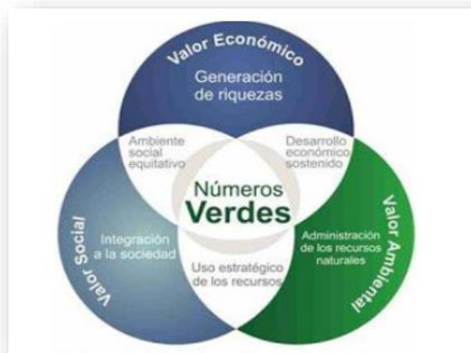
Figura 4. Modelo de Desarrollo Sustentable

naturales para suministrar la matriz energética que alimenta el funcionamiento de nuestros hogares e industrias se puede decir que de esta manera se maneja una sustentabilidad ecológica (Suárez, 2013), la cual consiste en acoger estrategias de negocio para cubrir las necesidades de la empresa y sus interesados, mientras se dirige y sustenta a los recursos naturales que serán necesarios en el futuro y se apoya en el desarrollo de la sociedad (Ávila & Pinkus , 2018), de acuerdo con el logro de cualquier proyecto se precisa a partir de la habilidad que tenga el decisor para modificar dichas alteraciones en ventajas (Ávila & Pinkus , 2018 ; Barbosa , 2016 ; Carro, et al., 2017; Zulueta, et al., 2013) (Figura 4).