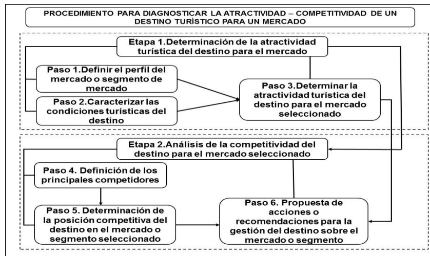
Figura N 1. Procedimiento para diagnosticar la atractividad competitividad de un destino turístico para un mercado.

Por estas razones fue necesario proponer un procedimiento más sencillo y ajustado a los intereses de la presente investigación, que partió de las experiencias precedentes y que favorece la obtención de la información necesaria sobre las variables a considerar para el estudio, por los propios investigadores. En la figura 1 se expresa gráficamente el procedimiento propuesto y seguidamente se explican de forma resumida los objetivos, descripción y técnicas a utilizar en las diferentes etapas y pasos.