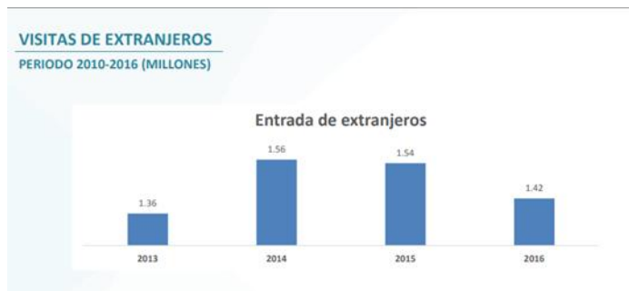
Figura N 3 Ventas de extranjeros periodo 2010 – 2016 (millones)