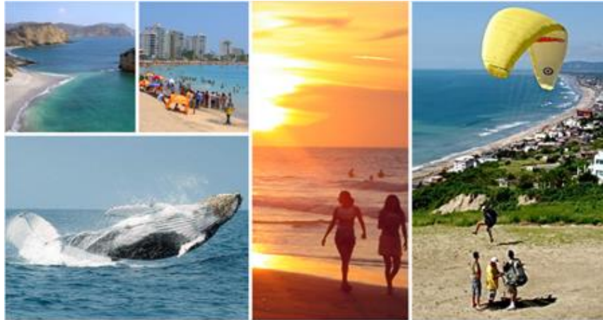
Figura N 1 Turismo

Para fomentar la diversificación del turismo, la desconcentración en el sol y la playa, la costa y el verano. Fomentar nuevos productos, nuevo destino de viajes fuera de temporada. Fomentar formas incipientes y alternativas de turismo: turismo rural, turismo activo, nuevas formas de turismo cultural, etc.