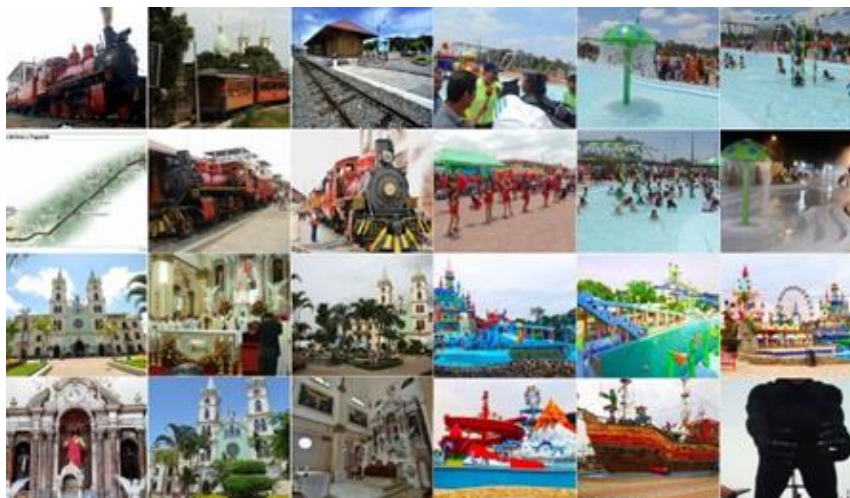
Figura N 2 Atractivos