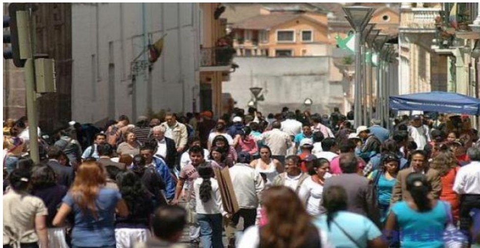
Figura N 4 Quito concentración de migrantes de diferentes poblaciones