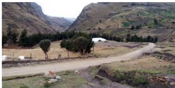
Figura N 2 Comunidad Michacalá