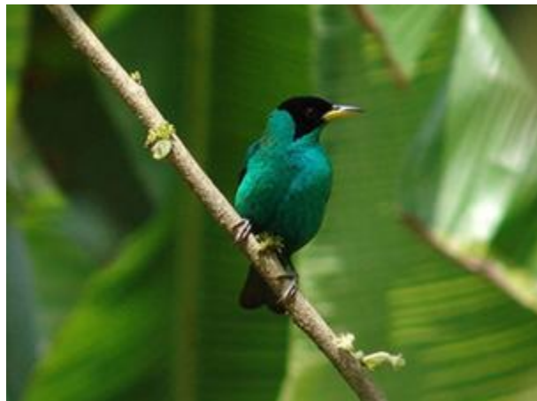
Figura N 2: Fauna de la Maná