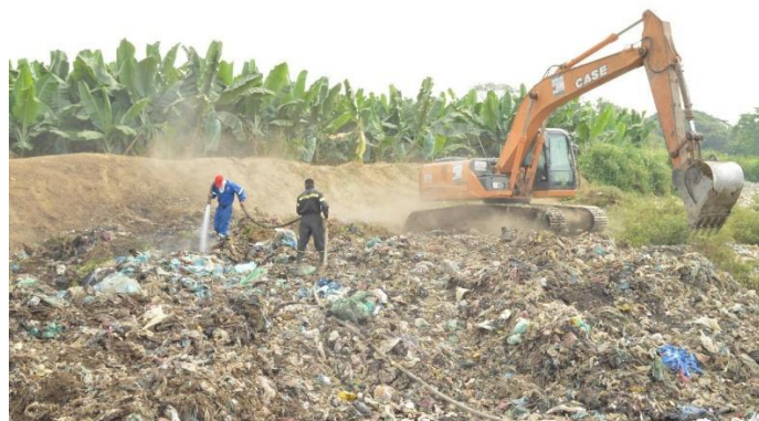
Figura N 4: Contaminación en la zonas alejadas de la mana

3.- Comercio de especies: Tuarez, (2016) la comercialización y exportación de especies para ser utilizados con fines científicos, para ornamentación o para criadero, han hecho peligrar la fauna de ciertas regiones. Un caso dramático es el del loro amazónico que es sacado de su hábitat para tenerlo encerrado en una jaula.