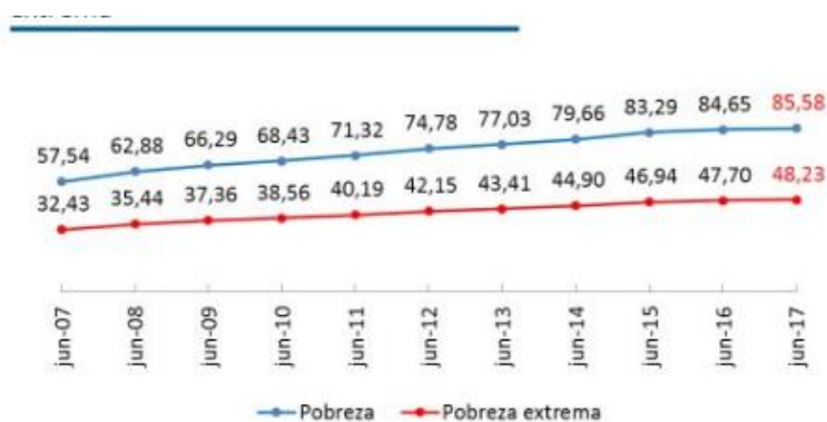
Figura N 4. Porcentajes de mendicidad en el Ecuador.

caritasarquidiocesana.org, (2015) y wikis, (2014) mencionan que la desnutrición infantil es una enfermedad que afecta sobre todo a los niños, niñas menores de cinco años y mayores de edad, este problema es provocada por la falta de alimentos y las recurrentes enfermedades que no les permite un buen ingreso biológico de los alimentos que ingieren. Entre las causas de desnutrición podemos mencionar la falta de alimentos en casa ya sea por baja disponibilidad o acceso, catástrofes naturales que obligan a las familias a abandonar sus hogares, suspensión de lactancia materna exclusiva a niños y niñas menores de 5 a 7 meses de edad por falta de ingesta alimentaria y nutricional de la madre, enfermedades como el SIDA, tuberculosis, sarampión, parasitosis graves, problemas políticos como guerras. Entre la mayoría de factores que facilitan la desnutrición factores de riesgo podemos hallar problemas de ingresos en las familias desempleo, problemas de cosechas, etcétera, falta de higiene agua sin tratar, falta de letrinas, alimentos mal preparados, y demás, enfermedades comunes diarreas, fiebres, neumonías, bajo nivel social y económico, alimentación inadecuada o monótona y problemas sociales.