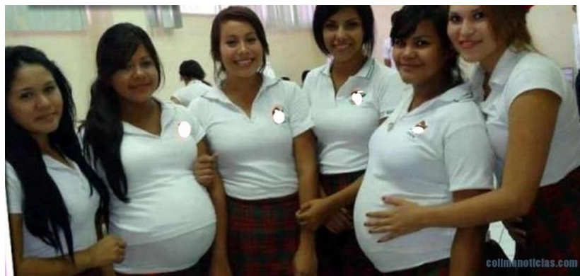
Figura N 2. Mujeres Embarazadas