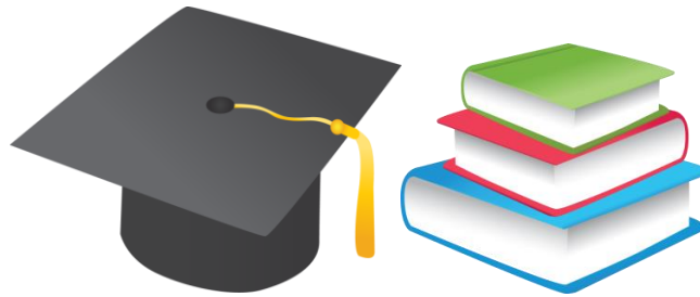
Figura N 5. Graduación Universitaria