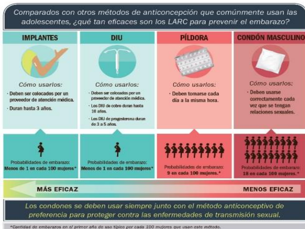
Figura N 4. Métodos de protección

La (Universia, 2014) nos da la información que un nuevo estudio estadounidense afirma que promoviendo el acceso gratuito a anticonceptivos y la educación sexual es posible reducir las posibilidades de embarazo y posteriores decisiones de aborto como el embarazo adolescente es un fenómeno global que despierta enorme preocupación entre las autoridades nacionales e internacionales sin embargo un estudio público en el new england journal of medicine las mujeres deberían seguir educación sexual y tienen al acceso gratuito a anticonceptivo corren menos riesgo de embarazo o de decidir abortar el estudio promueve especialmente los métodos de anticonceptivos de acción prolongada como los dispositivos o los implantes ya que son eficaces para combatir los embarazos adolescentes. Las adolescentes pueden tomar buenas decisiones cuando están informadas y tienen el apoyo de sus familiares u otros adultos de confianza.