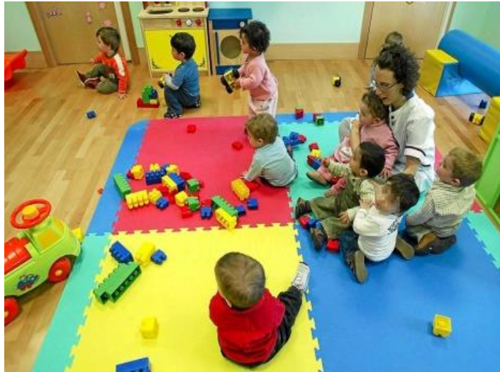
Figura N 6 .Guardería Universitaria