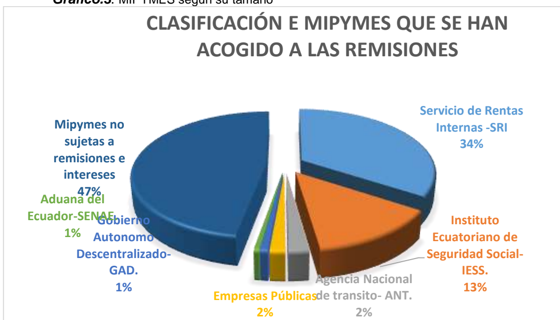
Gráfico.3. MIPYMES según su tamaño