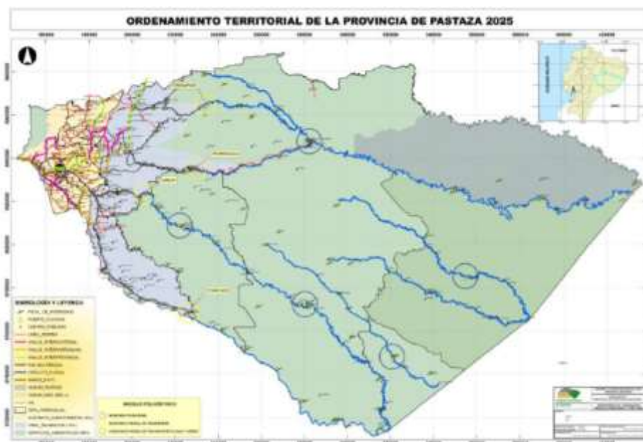
Ilustración 2. Modelo de Ordenamiento Territorial de la provincia de Pastaza

Conforme a la división política actual del Ecuador esta provincia, tiene 4 cantones y 21 parroquias: Pastaza (14 parroquias), Mera (3 parroquias), Santa Clara (2 parroquias) y Arajuno (2 parroquias). La relativamente reducida división política en tan extenso territorio es muestra de que se trata de una de las provincias todavía menos pobladas y explotadas, con una enorme riqueza de recursos naturales y biodiversidad. La información y datos que se presentan a continuación provienen del Informe sobre la Agenda productiva de transformación territorial, elaborada por el Ministerio de Coordinación de la Producción, empleo y competitividad. (MIPRO-ATTP, 2011)