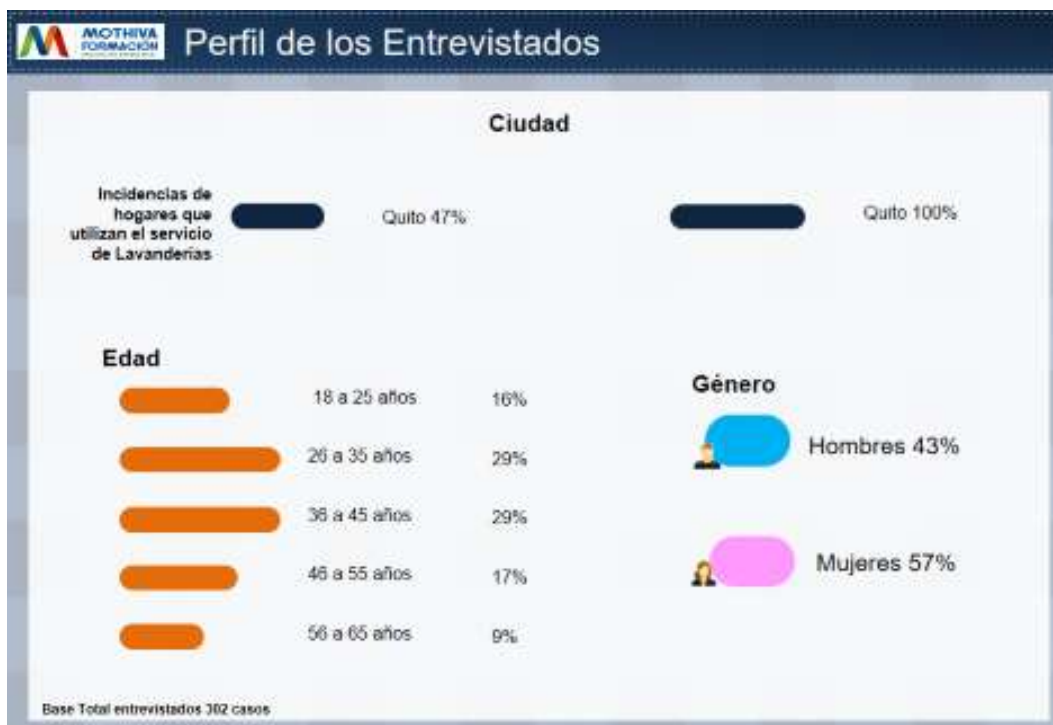
Gráfico No 1. Perfil de los entrevistados