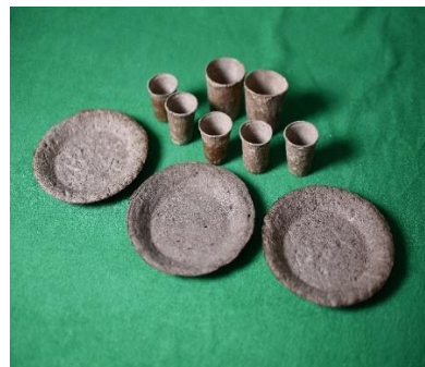
Figura 2: Utensilios obtenidos

aumento en la economía de estos, según afirmaciones del sector agrícola bananero se enuncia que los tallos generados durante el proceso de corte del producto listo para su comercialización, no poseen ningún valor o utilidad hasta este momento debido a la falta de investigación sobre el uso de estos, colocándonos de esta manera como los pioneros en la utilización y desarrollo de nuevas técnicas alternativas y viables del cuidado ambiental y generación de recursos económicos adicionales para este sector solventando el PIB de nuestro país, cabe mencionar que este proyecto fue tratado con gente del sector quien nos indicó que el precio por tallo sería de 25 centavos de dólar Americano dejando una rentabilidad para abonos y costos de funda para la protección del fruto lo suficientemente conveniente.