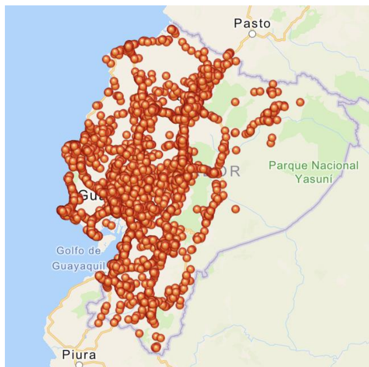
Figura 1. Siniestralidad en el Ecuador