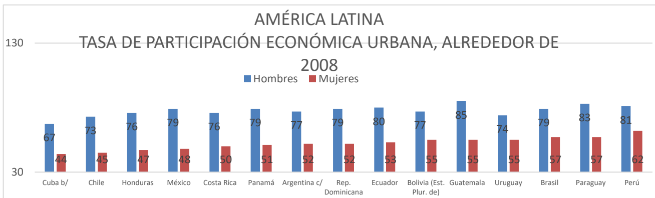
Grafica 2: América latina tasa de participación económica urbana, alrededor de 2008.